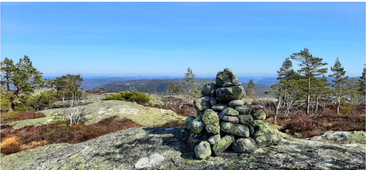
Marishei (573 moh) - Gjerstad kommunes høyeste topp

Kommunedirektørens forslag 22. november 2022