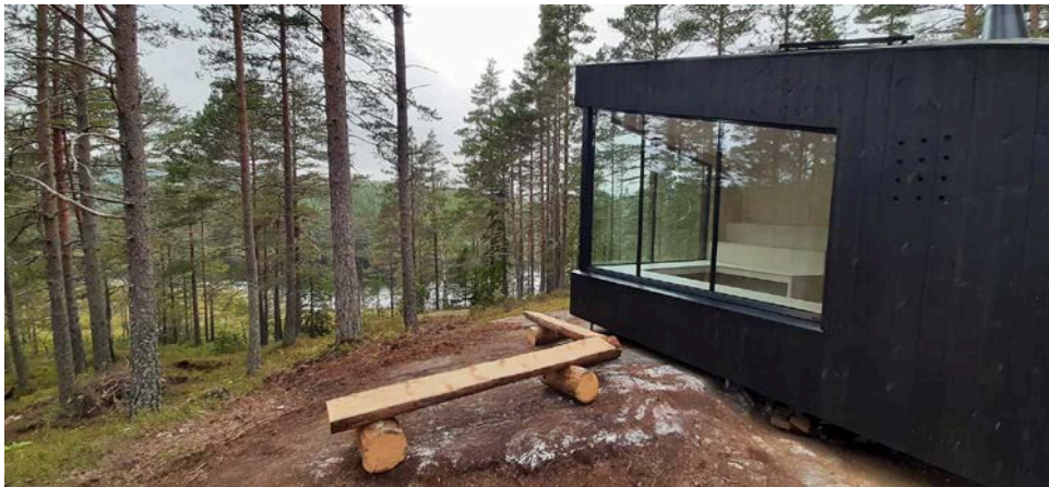
Dagsturhytta Tjennimellom i Gjerstad

Vedtatt i kommunestyret, sak 23/92 den 14.12.2023