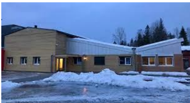
Ny helsestasjon ved Abel skole ble ferdigstilt desember 2021.