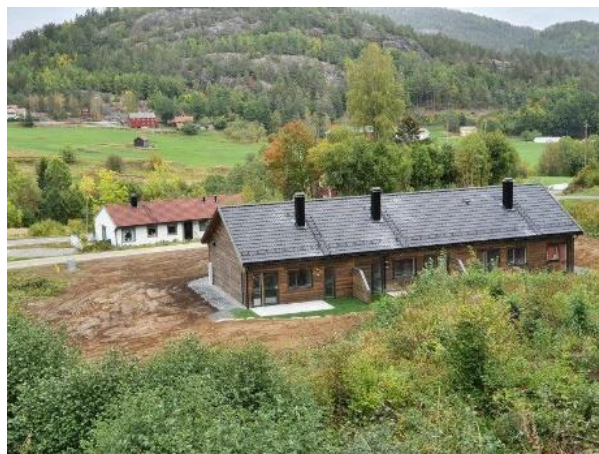
Tremannsbolig i Enghola boligfelt på Mostad ble ferdigstilt sommeren 2021. En stor leilighet med fire soverom og to mindre leiligheter med to soverom. Friområdet i boligfeltet Enghola ble delvis ferdigstilt i okt 2021. Dette blir en attraktiv leke- og møteplass for alle som bosetter seg i Enghola.