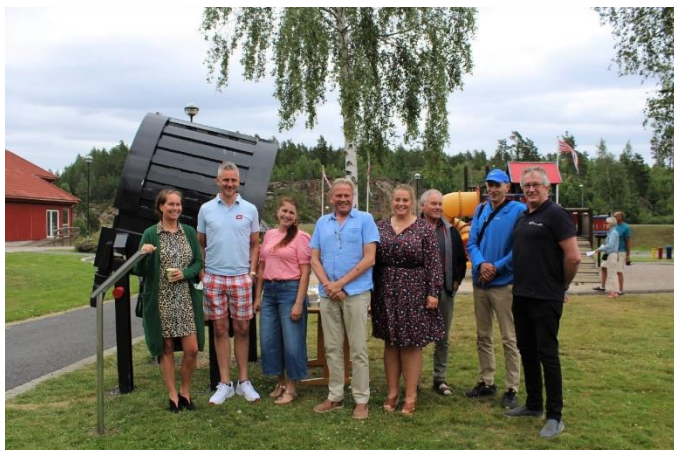
Sansegata på Brokelandsheia hadde offisiell åpning i juni 2021.