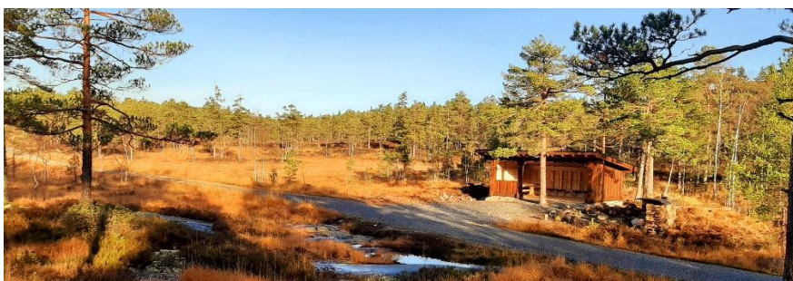
Ny gapahuk ved Kleivvann til bruk for alle både sommer og vinter (Havrefjell Turlag)