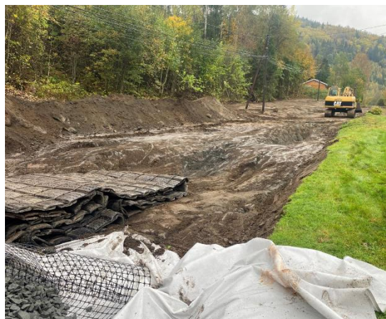
580 meter av Vestølveien ble utbedret i 2021.