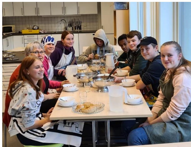
Mat og helse 9. trinn