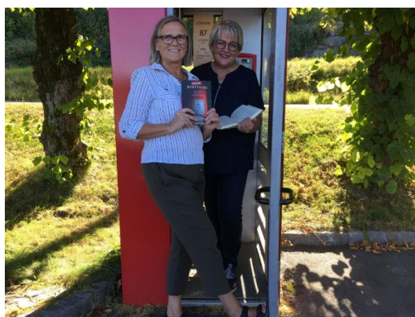
Ordfører og biblioteksjef i lesekosken. Offisiell åpning i september 2021.