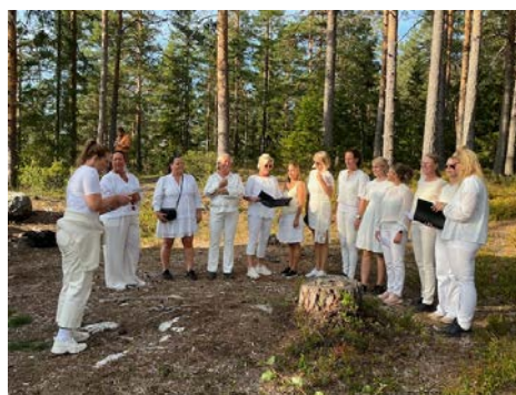
Friluftsåret 2025: Turer med kulturelle innslag.