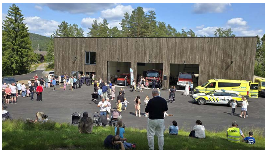
Åpning av ny brannstasjon

Kjøpet av barnevernsbygget, byggingen av utleieboliger og ferdigstillelsen av den nye brannstasjonen er prosjektene med de største kostnadene enkeltvis. Oppgradering av kommunale veier og etableringen av nye lokaler for praktisk-estetiske fag ved Abel skole er også to prosjekter av stor betydning. De fleste prosjektene ble slutført innenfor vedtatt budsjetttramme.