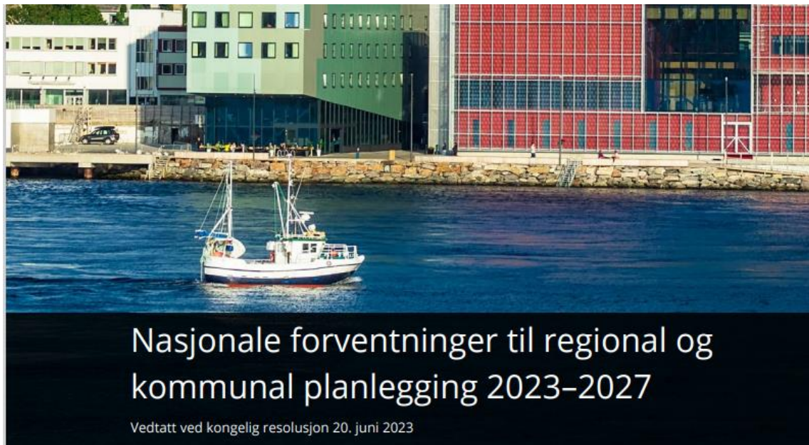
Figur 2. Nasjonale forventninger til regional og kommunal planlegging 2023-2027

Nasjonale forventninger til regional og kommunal planlegging 2023-2027 skal følges opp i fylkeskommunenes og kommunenes arbeid med planstrategier og planer, og skal legges til grunn for statlige myndigheters medvirkning i planleggingen.