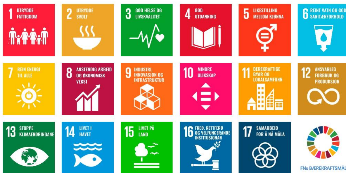
Figur 1. FNs bærekraftsmål er verdens felles arbeidsplan for å utrydde fattigdom, bekjempe ulikhet og stoppe klimaendringene innen 2030.

I 2015 ble 2030-agendaen med de 17 bærekraftsmålene vedtatt av alle FNs medlemsland, inkludert Norge. Bærekraftsmålene ser miljø, økonomi og sosial utvikling i sammenheng. Et sentralt prinsipp i 2030-agendaen er at ingen skal utelates. De mest sårbare og marginaliserte menneskene og gruppene i verden skal inkluderes i utviklingen. Bærekraftsmålene krever felles innsats fra myndigheter, sivilsamfunn, privat sektor og akademia i alle land.